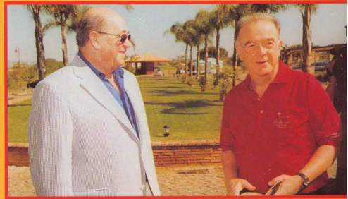
Vilamoura acolhe a 3. a edição da Taça Presidente da República